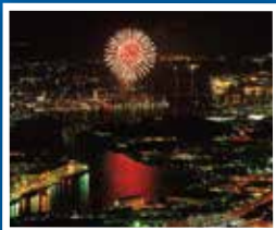
구키노우미 만과 '구키노우미 불꽃놀이'

역사와 미래가 한데 어우러진 도시 기타큐슈를 한 눈으로 바라볼 수 있다.