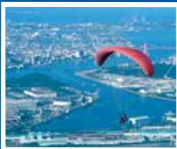
사라쿠라야마 산은 패러글라이딩의 성지입니다.