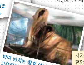
박력 넘치는 황후 삼나무의 그루터기를 전시 수령 200년, 높이 3.4m

시가지를 한눈에 바라볼 수 있는 파노라마 전망대입니다. 전망실에서 바라보는 웅대한 경치는 계절감이 넘쳐흘러 매력적입니다. 야간에는 데크에 깔려 있는 축광석이 환상적인 공간을 연출합니다. 슬로프카의 전망대 역과 인접하고 있으며 휴식·레스토랑·라이브 이벤트·대피소 등 다양한 기능을 가진 시설입니다.