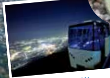
360도를 조망할 수 있는 슬로프카 내부

케이블카를 탄 후에는 슬로프카로 산 정상까지. 전면 통유리로 된 탁트인 차창에서는 기타큐슈 시내에서 간몬 해협까지 파노라마처럼 펼쳐지는 경치를 바라볼 수 있습니다. 낮에 보는 경치는 물론 야경의 아름다움은 마치 보석상자 같습니다. 산정상 전망대까지 약 3분만에 이어줍니다.