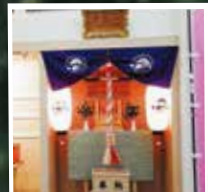
산상 역에 있는 케이블카 신사와 사람 운세뽑기