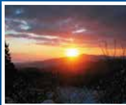
신년 일출 때는 케이블카도 새벽 운행

기타큐슈를 대표하는 산, 사라쿠라야마 산(표고 622m)에서 바라보는 파노라마처럼 펼쳐지는 경치(시야 각도 200도)는 모두가 감동할 만한 압도적인 스케일을 자랑합니다. 현해탄, 히비키나다·스오나다 해역에 접하며 동서북쪽으로 넓게 펼쳐져 있어, 구키노우미 만, 간문 해협, 기타큐슈 공항 등 산과 바다 그리고 도시가 어우러진 인구 100만명의 도시 기타큐슈시 내외의 전경을 바라볼 수 있습니다. 본격적인 등산 코스 수준의 표고이지만 케이블카·슬로프카를 갈아타면 약 10분만에 가볍게 산정상까지 갈 수 있는 것도 인기의 비결. 또한 2015년 4월 1일에 '사라쿠라야마 산정상'과 '사라쿠라야마 야경'이 '연인의 성지'로 선정되었습니다. 꼭 한번 이 최상의 경치를 즐겨 주십시오.