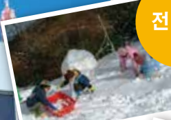
겨울은 눈놀이를 즐기는 어린이들로 붐빕니다.