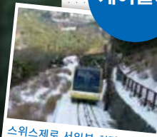
스위스제로 서일본 최장급 케이블카