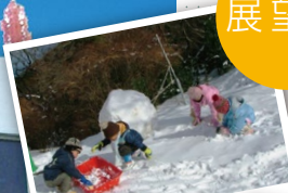
冬天玩雪的 孩子們盡情嬉戲

可將市街一覽無遺的展望台。從展望台所眺望的壯麗景色充滿季節感，引人入勝。晚間，鋪滿光石的甲板創造出一個夢幻空間。展望台鄰接爬坡車的展望台站，是一個包括休息、餐廳、現場活動、避難等的多功能設施。