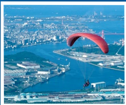
血倉山是滑翔傘的中心地