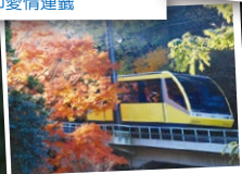
藍色：Kanata（彼方）號 黃色：Haruka（遙遠）號