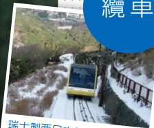
瑞士製西日本最長的 纜車