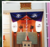
位於山上站的纜車 神社和愛情運籤