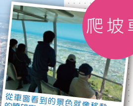
從車窗看到的景色就像移動 的瞭望臺