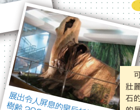
展出令人屏息的皇后杉樹樁 樹齡200年、高3.4公尺