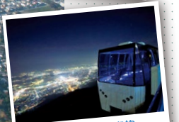
360度美景盡收眼底的 爬坡車內

乘坐纜車後轉搭爬坡車到山頂。從四面玻璃無任何遮蔽物的車窗，可將北九州市到關門的景色盡收眼底。白天自不必說，夜景之美就好像珠寶盒一樣。約3分鐘即可抵達山頂展望台。